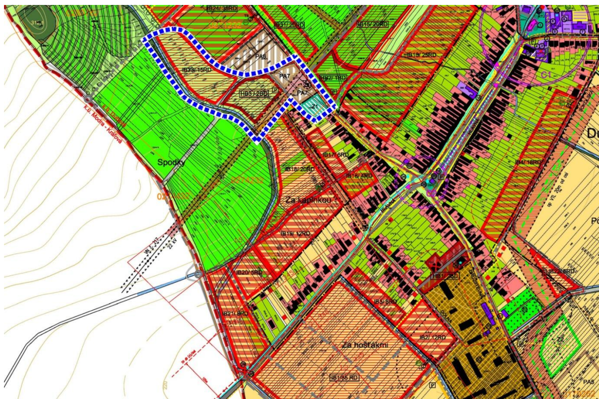
Schéma 2 Vymedzenie riešeného územia

Celková výmera riešeného územia je cca 2,39 ha. Druhy pozemkov v dotknutom území sú prevažne záhrady, orná pôda a ostatné plochy.