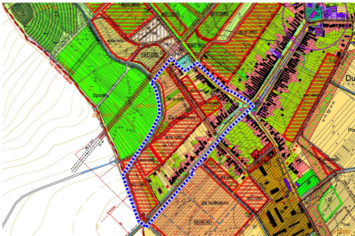
Obrázok - Schéma 1 Vymedzenie riešeného územia

Celková výmera riešeného územia je cca 6,3 ha. Druhy pozemkov v dotknutom území sú prevažne záhrady, orná pôda a ostatné plochy.